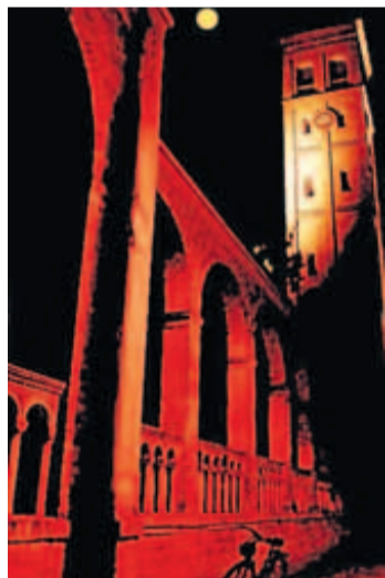
Die Bornstedter Kirche.

HERZLICH GRÜSST PFARRER FRIEDHELM WIZISLA