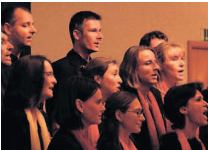
Der Chor „Kirchenwind“ wird auch in dieser Nacht der offenen Kirchen mit einem Konzert in der Baptistenkirche in der Schopenhauerstraße aufwarten.

Das ganze Programm auch unter: www.evkirchepotsdam.de