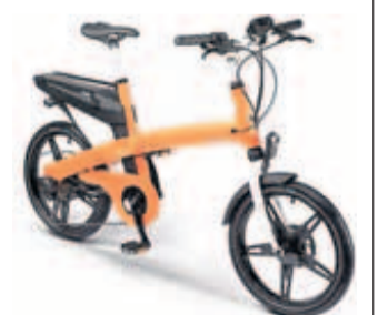
In diesem Jahr kann man auch mit E-Bikes die Kirchen erreichen.

Fahrradausleihe Auch zur 6. Nacht der offenen Kirchen besteht wieder die Möglichkeit, an der St. Nikolaikirche kostenlos ein Fahrrad auszuleihen. Personalweise sind bitte mitzubringen. Die Fahrräder müs- sen bis 23 Uhr am Grünen Gitter wieder abgegeben werden. Die Ausleihe eines E-Bikes kostet 15 Euro. Das Wassertaxi nach Sacrow, das während der Fahrrad- tour benutzt werden muss, kostet 4 Euro für das Wassertaxi.