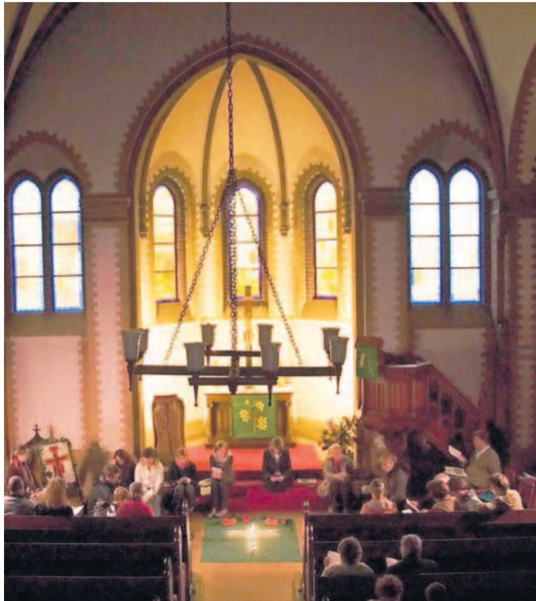
Die Christuskirche in der Potsdamer Behlerstraße, eingezwängt zwischen zwei Wohnhäusern, ist das Zentrum der altlutherischen Gemeinde. In das stille Gotteshaus wird eingeladen zu Orgelmusik und zu Taizémeditationen.

Einige Kirchen wie etwa die Friedenskirche oder die gerade fertig restaurierte zentrale St. Nikolaikirche haben ja eigene Beleuchtungsmöglichkeiten. Gerade aber die kleineren Kirchen im Norden un-